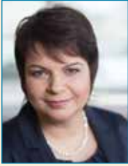
Stefanie Drese Ministerin für Soziales, Integration Gleichstellung des Landes Mecklenburg-Vorpommern