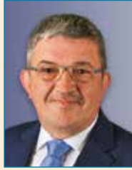
Lorenz Caffier Minister für Inneres und Europa des Landes Mecklenburg-Vorpommern

Sehr geehrte Damen und Herren, seit vielen Jahren arbeiten im Land Mecklenburg-Vorpommern staatliche und nichtstaatliche Ebenen erfolgreich zusammen, um Betroffene von häuslicher und sexualisierter Gewalt zu schützen und zu stärken. Artikel 7 der Istanbul-Konvention hebt ebenfalls die Bedeutung des gemeinsamen und strukturierten Zusammenarbeitens der verschiedenen Professionen als umfassende Antwort auf Gewalt und Bedrohung hervor. Das ist gerade bei Vorliegen einer Hochrisikosituation oder in der Phase der Trennung besonders wichtig. Die Betroffenen benötigen besonders intensiven Schutz und Unterstützung. Darüber hinaus kann es auch wichtige Hinweise zur Verhinderung anderer Gewalttaten geben.